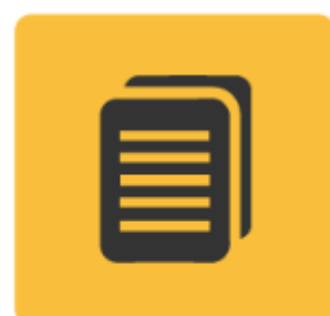
Solicitud de Admisión a Residencias