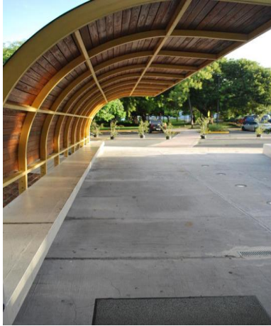
Foto de salida de emergencia hacia el estacionamiento PG7 de la Universidad

Salida de emergencia entrada principal – salir hacia el hacia el estacionamiento PG7 y el gazebo frente a Pastoral.