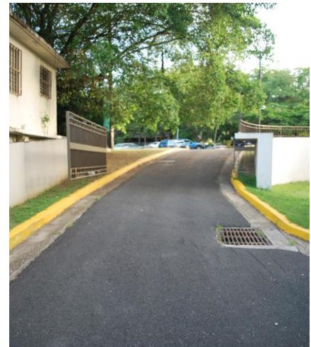
Foto de salida de emergencia hacia el estacionamiento de la Universidad