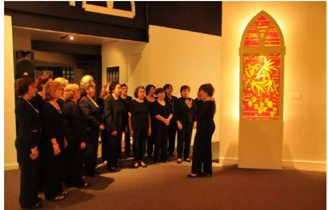
El Coro de Antiguas Alumnas durante su presentación en la exposición “Visiones y transfiguraciones: hacia una capilla criolla” del artista Eddie Ferraioli.

El horario de visitas a la exposición es de miércoles a sábados, de 9:00 a.m. a 5:00 p.m. Para más información, comuníquese a la extensión 2408 .